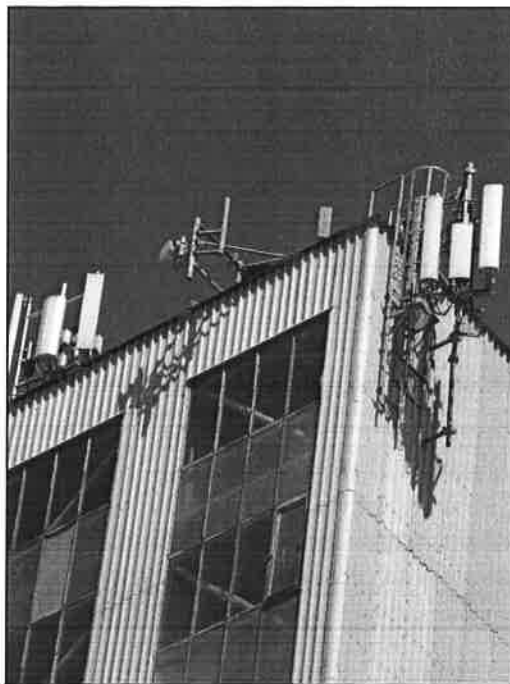
Rys. 4 Widok badanego obiektu