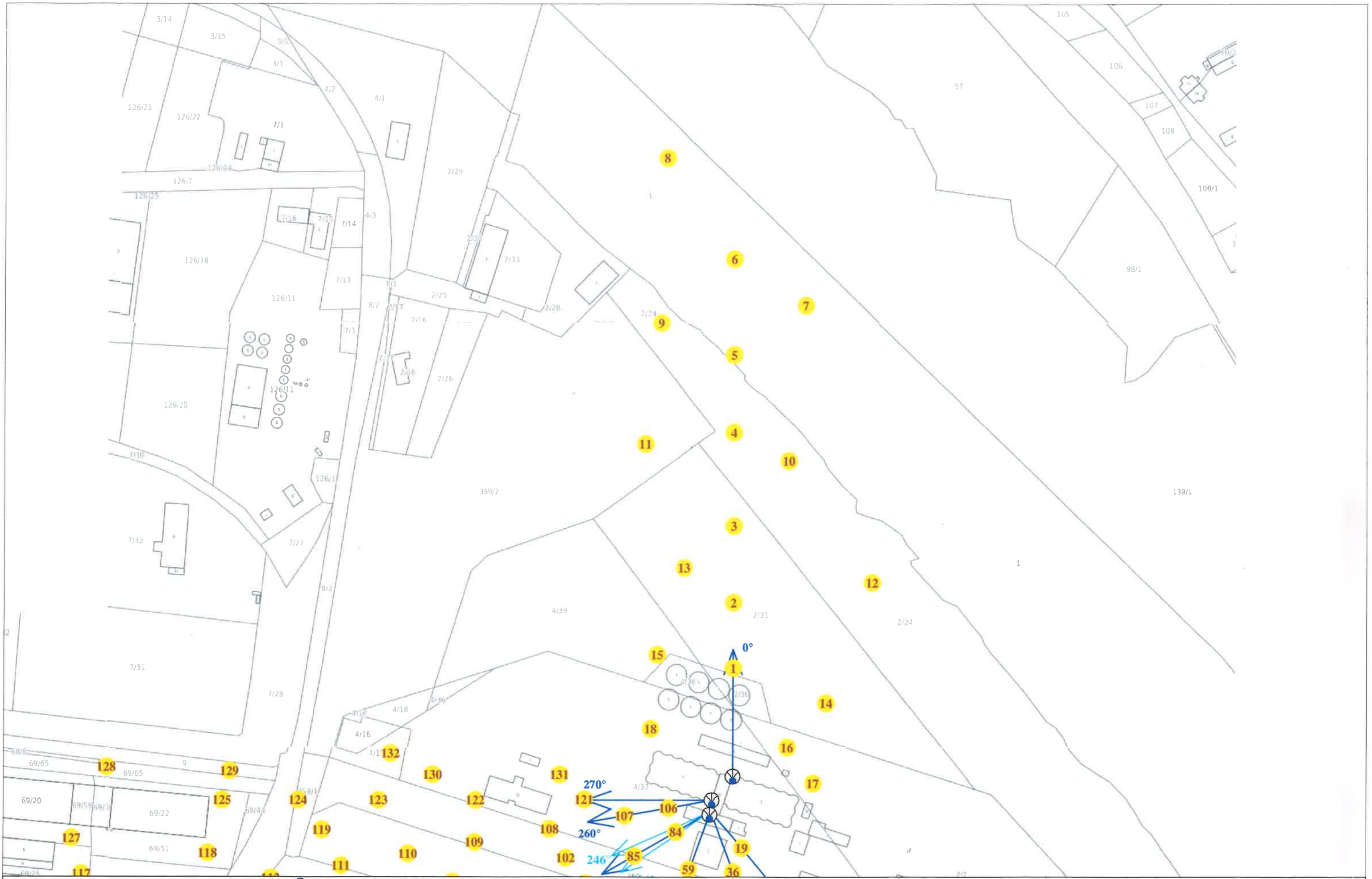
Rys. 2 Lokalizacja pionów pomiarowych

Legenda: brak dostępu antena radioliniowa źródło PEM pion pomiarowy antena sektorowa