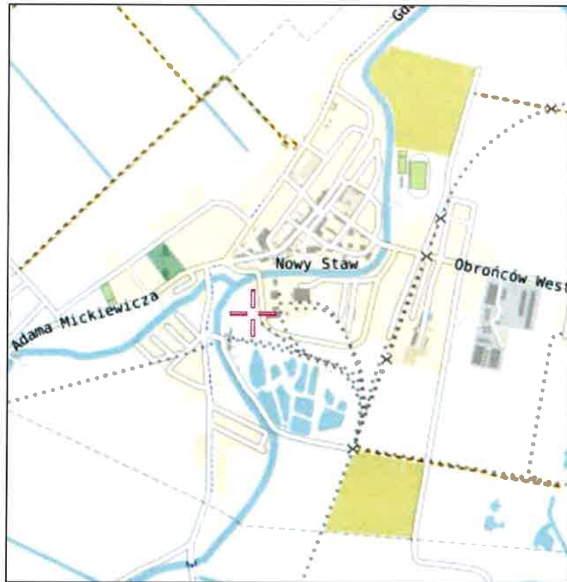
Rys. 1 Lokalizacja badanego obiektu